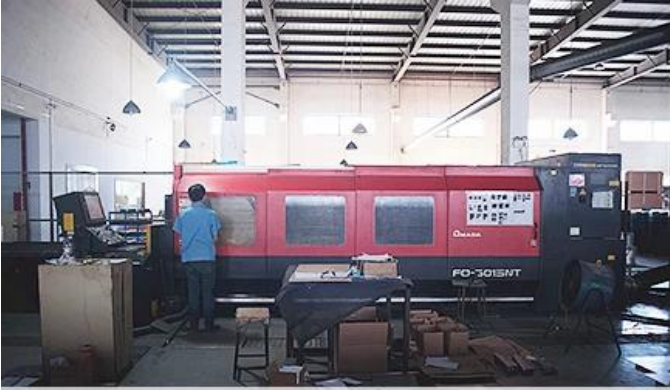
Laser Cutting Machine

Lazer kesim makinemiz, robot kaynak makinemiz, bükme makinemiz, damgalama makinemiz, cnc makinemiz var. işleme merkezleri, freze makinesi, taşlama makinesi, enjeksiyon kalıp makinesi vb. ekipmanlar. Çoğu metal ürünü üretebilir.