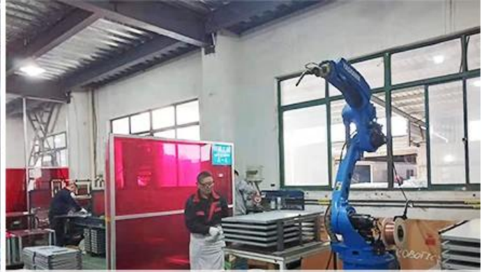
Robot Welding Machine