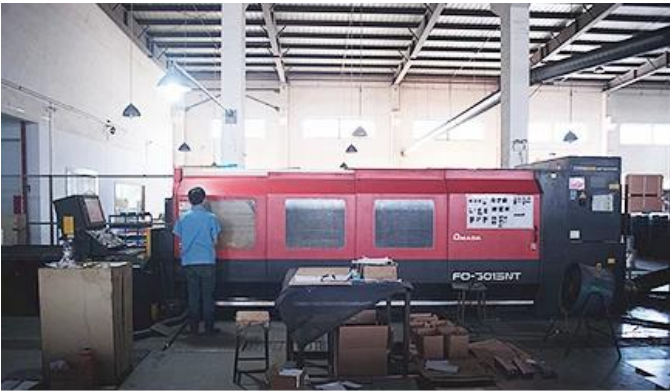
Laser Cutting Machine

Lazer kesim makinemiz, robotlu kaynak makinesi, bükme makinesi, damgalama makinesi, cnc var işleme merkezleri, freze makinesi, taşlama makinesi, enjeksiyon kalıp makinesi vb. ekipmanlar. Çoğu metal ürünü üretebilir.