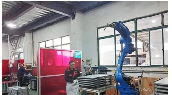
Robot Welding Machine