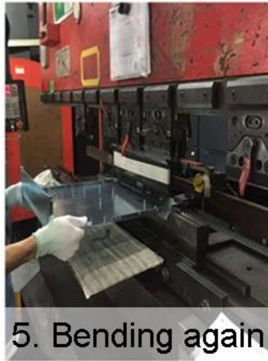
5. Bending again