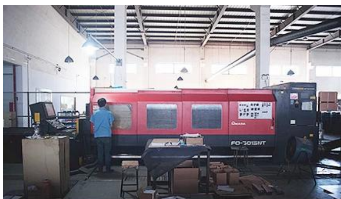
Laser Cutting Machine

У нас есть станок для лазерной резки, роботизированный сварочный станок, гибочный станок, штамповочный станок, ЧПУ обрабатывающие центры, фрезерный станок, шлифовальный станок, машина для литья под давлением и т. д. оборудование. Может производить большинство металлических изделий.