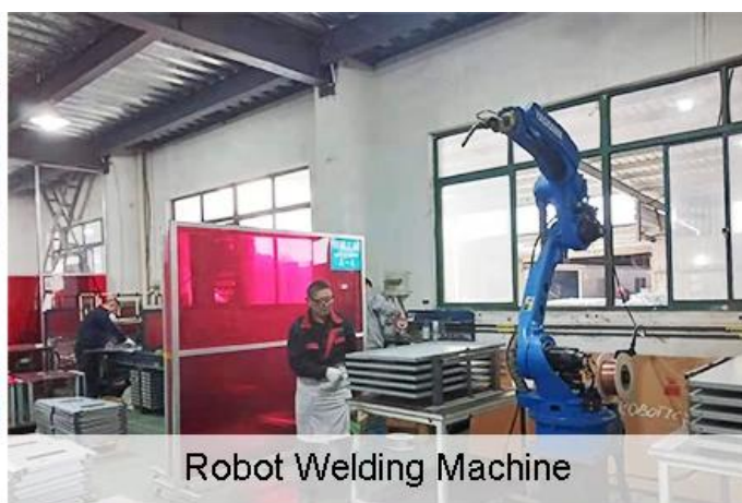
Robot Welding Machine