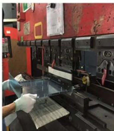
5. Bending again