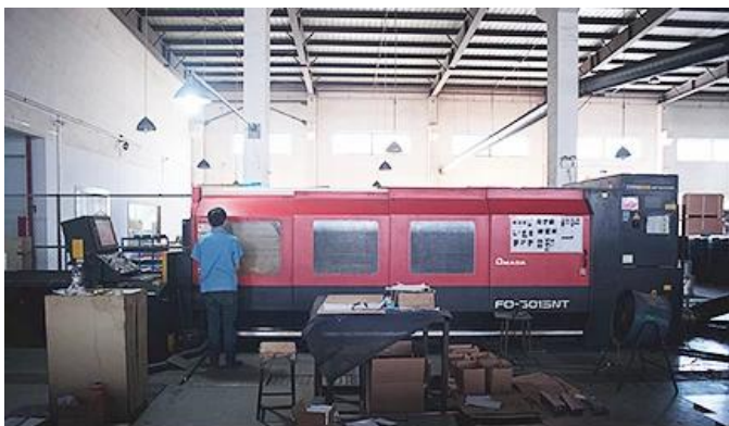
Laser Cutting Machine

We hebben lasersnijmachine, robot welding machine, buigmachine, stempelmachine, cnc bewerkingscentra, freesmachine, slijpmachine, spuitgietmachine enzovoort; apparatuur. Kan de meeste metalen producten produceren.