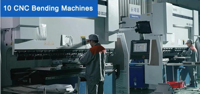
10 CNC Bending Machines