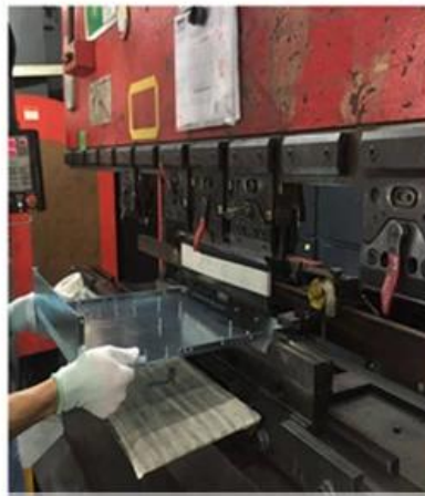
5. Bending again