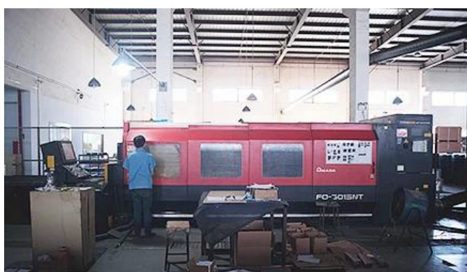
Laser Cutting Machine

Disponiamo di macchine da taglio laser, saldatrici robotizzate, piegatrici, stampatrici, cnc centri di lavoro, fresatrice, rettificatrice, macchina per stampi ad iniezione e così via attrezzature. Può produrre la maggior parte dei prodotti in metallo.