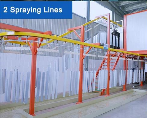
2 Spraying Lines