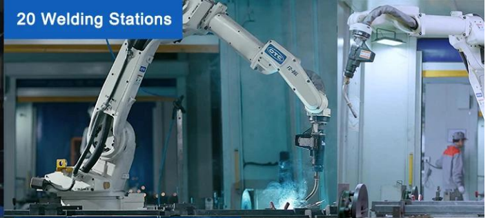
20 Welding Stations