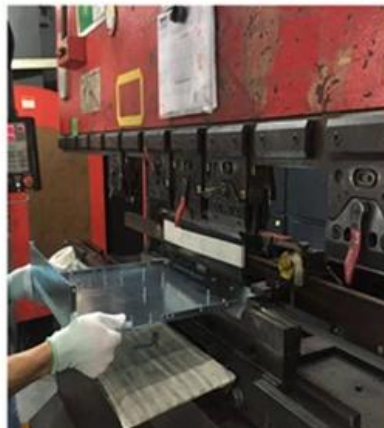
5. Bending again