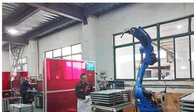
Robot Welding Machine