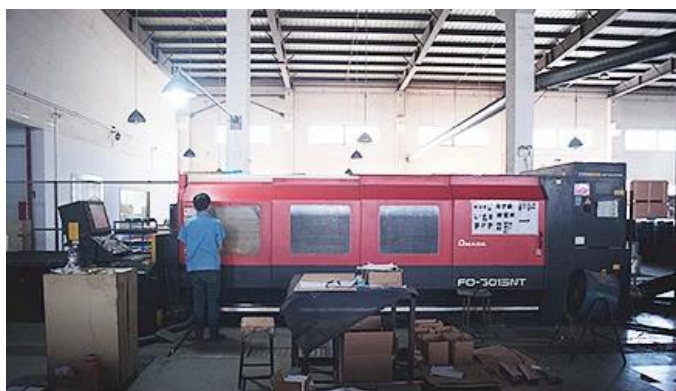
Laser Cutting Machine

Nous avons une machine de découpe laser, une machine de soudage robotisée, une machine à cintrer, une machine à emboutir, CNC centres d'usinage, fraiseuse, rectifieuse, machine de moulage par injection et ainsi de suite équipements. Peut produire la plupart des produits métalliques.