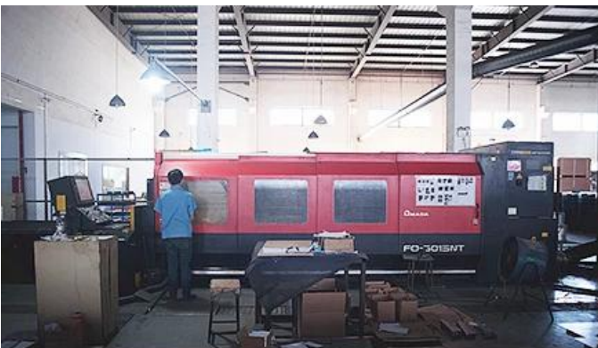
Laser Cutting Machine

Tenemos máquina de corte por láser, máquina de soldar robot, máquina dobladora, máquina de estampado, cnc Centros de mecanizado, fresadora, rectificadora, máquina de moldeo por inyección, etc. equipos Puede producir la mayoría de los productos de metal.