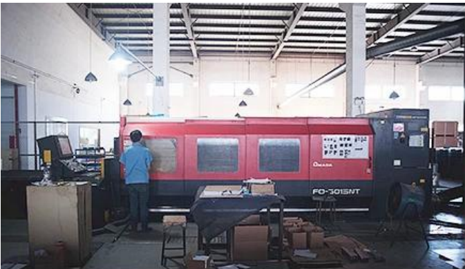
Laser Cutting Machine

Tenemos máquina de corte por láser, máquina de soldar robot, máquina dobladora, máquina de estampado, cnc Centros de mecanizado, fresadora, rectificadora, máquina de moldeo por inyección, etc. equipos Puede producir la mayoría de los productos de metal.