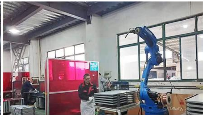
Robot Welding Machine