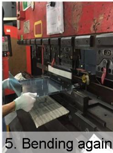
5. Bending again