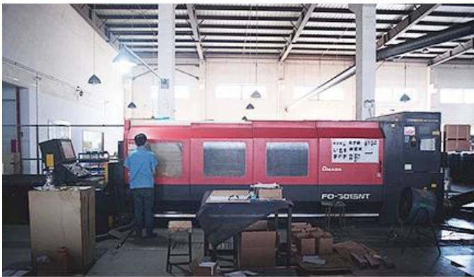
Laser Cutting Machine

Wir haben Laserschneidemaschine, Roboterschweißmaschine, Biegemaschine, Stanzmaschine, CNC Bearbeitungszentren, Fräsmaschine, Schleifmaschine, Spritzgussmaschine und so weiter Ausrüstungen. Kann die meisten Metallprodukte herstellen.