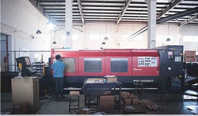
Laser Cutting Machine