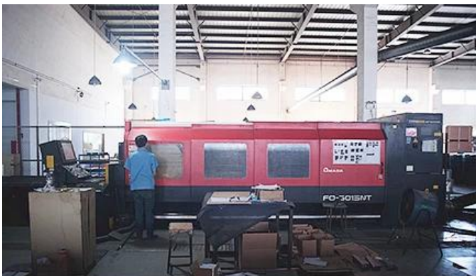
Laser Cutting Machine

Wir haben Laserschneidemaschine, Roboterschweißmaschine, Biegemaschine, Stanzmaschine, CNC Bearbeitungszentren, Fräsmaschine, Schleifmaschine, Spritzgussmaschine und so weiter Ausrüstungen. Kann die meisten Metallprodukte herstellen.