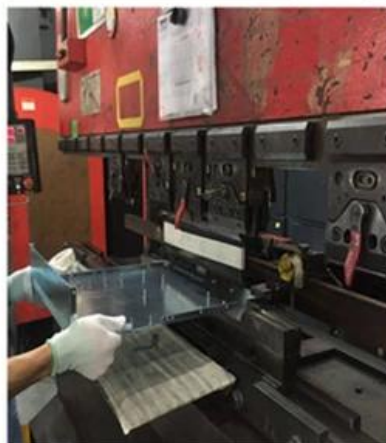
5. Bending again