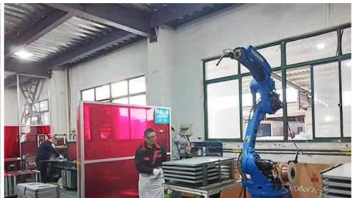
Robot Welding Machine