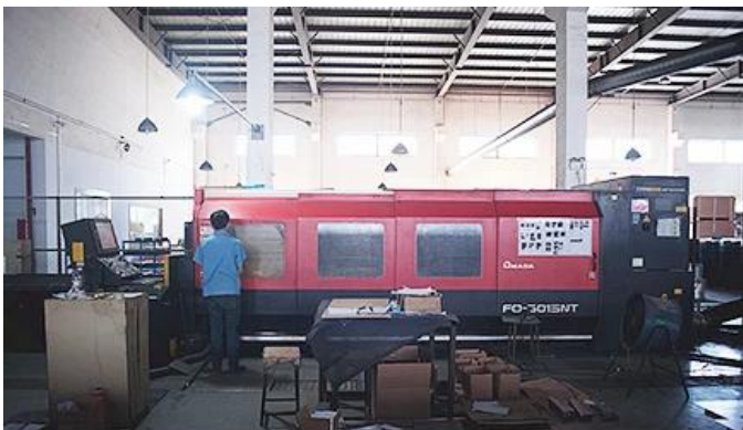
Laser Cutting Machine

Wir haben Laserschneidemaschine, Roboterschweißmaschine, Biegemaschine, Stanzmaschine, CNC Bearbeitungszentren, Fräsmaschine, Schleifmaschine, Spritzgussmaschine und so weiter Ausrüstungen. Kann die meisten Metallprodukte herstellen.