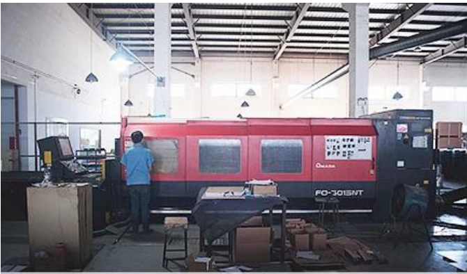
Laser Cutting Machine

مراكز التصنيع ، آلة الطحن ، آلة قوالب الحقن CNC ، لدينا آلة القطع بالليزر ، آلة لحام الروبوت ، آلة الثني ، آلة الختم وما إلى ذلك المعدات. يمكن أن تنتج معظم المنتجات المعدنية