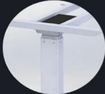
Out Tube size can be 90mmX60mm