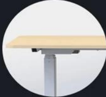
Motor metal case Ultra-thin design