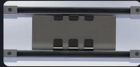
Control box installation: Plug type Patent design,It is more convenient