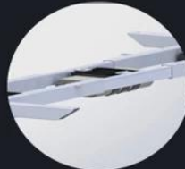
Control box patent design, Ultra-thin, small Switching power supply Metal case, have qualitative feeling