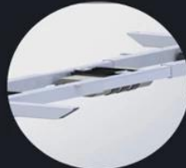
Control box patent design, Ultra-thin,small Switching power supply Metal case,have qualitative feeling